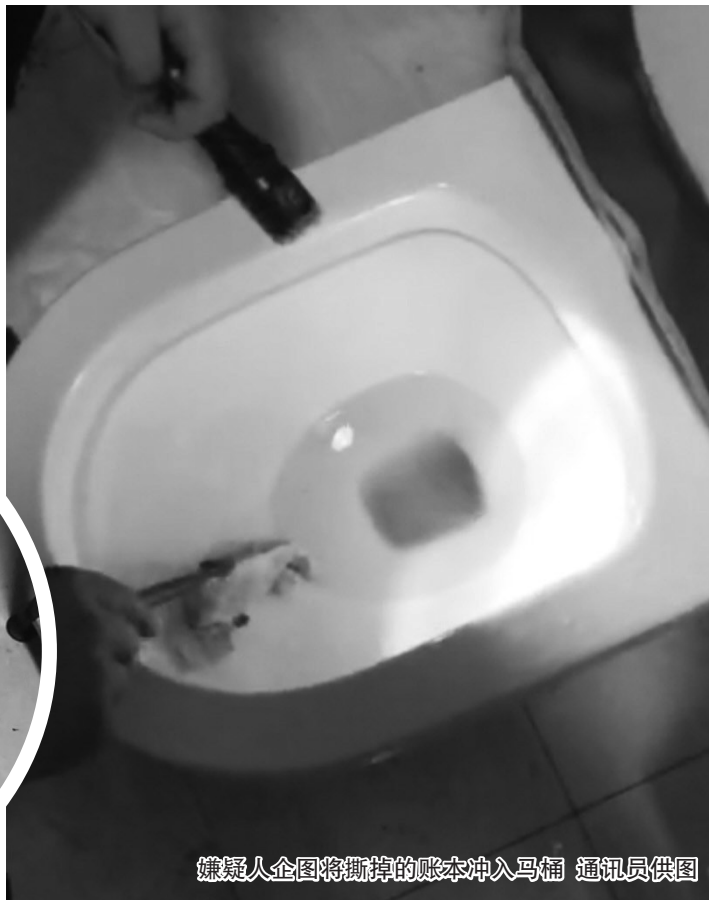
嫌疑人企图将撕掉的账本冲入马桶