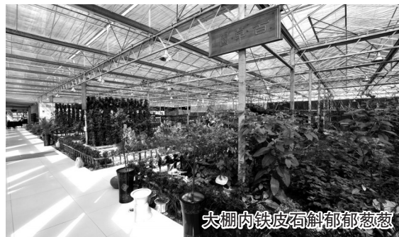
大棚内铁皮石斛郁郁葱葱

易中禾仙草园坐落于宁波东钱湖畔一云龙,早在公元前1000年,这里曾是春秋战国徐偃王的隐居之地,现今,已是宁波市政府立项的铁皮石斛生态种植、养生文化精品园,占地200亩,拥有全天候专业的铁皮石斛、金线莲组培、种植、加工大棚百余个,让人们走近铁皮石斛、金线莲等中药材的同时,了解中医药养生文化与旅游为一体的科普休闲生活。