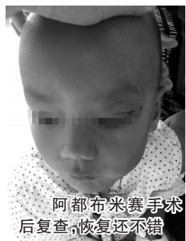
阿都布米赛手术后复查,恢复还不错