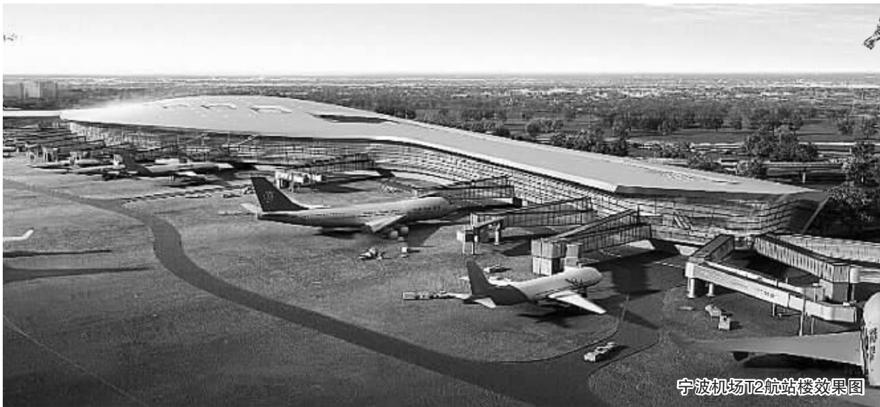
宁波机场T2航站楼效果图

■ 2017.11.15 星期三 ■ 热线:66111111 ■ 网址:www.jinbaonet.com ■ 编辑:王红光 ■ 版式:许明 校对:颜琪华