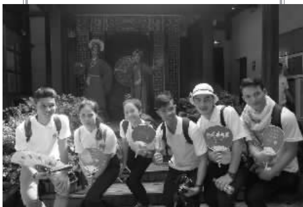
“澜湄文化行”成员和闽剧演员合影