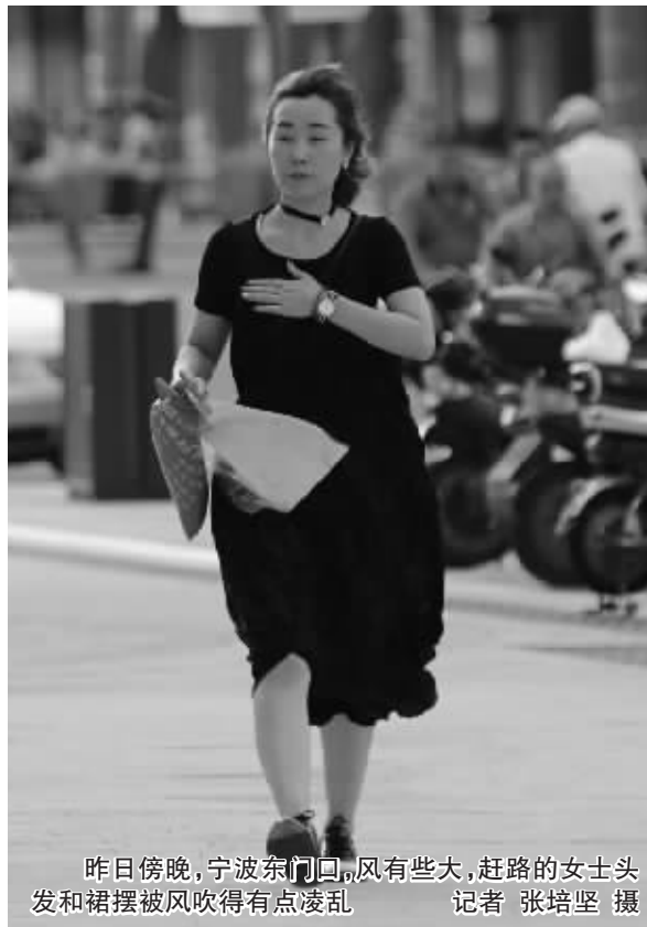
昨日傍晚,宁波东门口,风有些大,赶路的女士头发和裙摆被风吹得有点凌乱