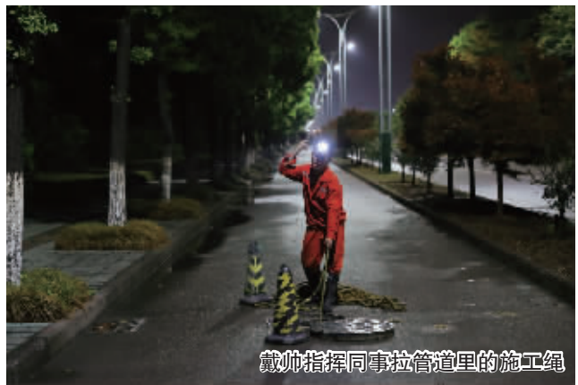
戴帅指挥同事拉管道里的施工绳