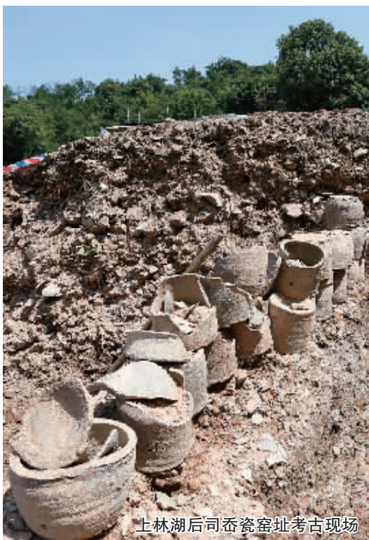
上林湖后司岙瓷窑址考古现场

可惜的是,南宋早期之后,因为朝廷政治、自然资源等多方面原因,越窑逐渐走向没落,最终荒废。“今明两年,我们会对几年来发掘的材料进行整理。有很多未知可以从整理过程中揭示。”