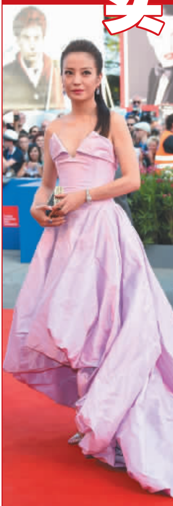
赵薇亮相威尼斯红毯